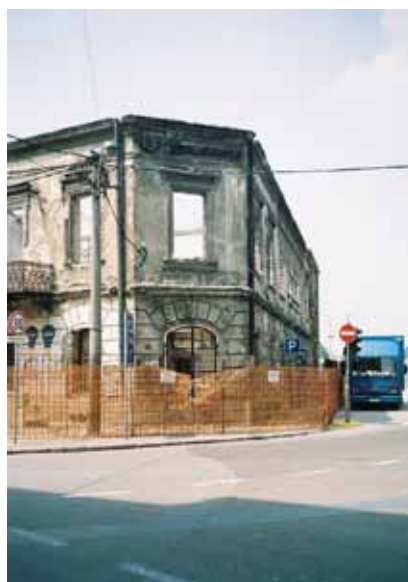
Sl. 22. Stara carinarnica

U istoj ulici nalazi se i nekadašnji magacin „Centrotekstila“, privatizovan i van upotrebe (Sl. 23). Svi navedeni objekti zauzimaju parnu stranu ulice Braće Krsmanović i okrenuti su prema Savi. Direktna prilaz reci sprečava postojeća železnička pruga.