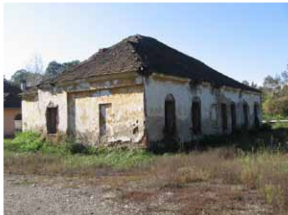
Sl. 78. Stara škola u Vreocima

Primer Stare kuće porodice Miletić govori u prilog tome kako nezainteresovanost, posebno na lokalnom nivou, dovodi do devastacije značajnih spomenika kulture.