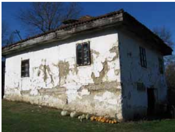
Sl. 100. Kuća Jevrema Sirkovića

nastanjena, obližnja kuća Jevrema Sirkovića danas se koristi samo povremeno, a pre svega za odlaganje stvari (Sl. 100). Zanimljivost vezana za tu kuću je ćup u kome se nekada čuvao novac, uzidan u jedan od zidova u podrumskim prostorijama.