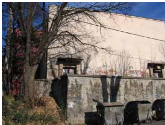
Sl. 39. Terasa bioskopa

Kada su u pitanju nedovršeni građevinski poduhvati, treba pomenuti poslovni objekat u delu Južnog bulevara prema Autokomandi (Sl. 40). Gradnja tog objekta počela je još 90-ih godina prošlog veka. Osim što predstavlja ruglo za nedavno renoviran Južni bulevar, taj objekat postao je i mesto okupljanja „ilegalnih stanara“.