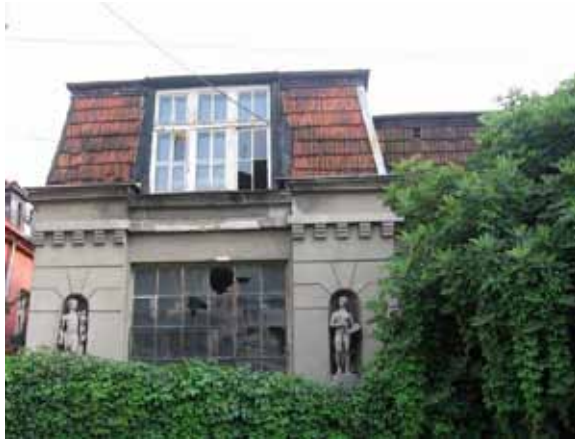
Sl. 41. Kuća vajara Đoke Jovanovića