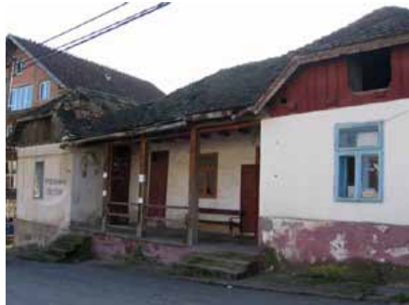
Sl. 96. Mesna zajednica, policijska stanica, ambulanta...

Drugi obilazak Sopot, odnosno seoskih naselja u južnom delu opštine, otkrio je niz građevina koje možemo svrstati u grupe poslovnih, poslovno-stambenih i stambenih prostora. Istraživanje je obuhvatilo mesta Slatina, Sibnica, Drlupa i Rogača.