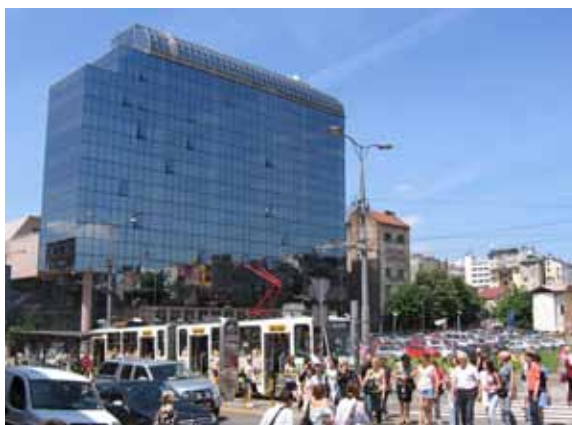
Sl. 37. Slavija

Prostorna celina istražena na teritoriji Vračara je Trg Slavija, jedna od ključnih i urbanistički najneobičajnijih gradskih tačaka (Sl. 5, 6, 37). Na prvi pogled prostor Slavije deluje „popunjeno“. Ipak, detaljnijim ispitivanjem zaključujemo da su to zapravo prostori samo privremeno ispunjeni određenim sadržajima. Na mestima nekadašnjih objekata, od kojih je jedan i bioskop „Slavija“, srušen 1991. godine, 238 prazan prostor popunjen je parkinzima i uličnim tezgama. Nesklad naročito dolazi do izražaja poređenjem tih prostora i okolnih objekata iz različitih epoha – građevina sa kraja XIX i iz prve polovine XX veka, hotela „Slavija“ i „Slavija Lux“ iz 60-ih i 80-ih godina prošlog veka i naročito, zastakljenog „giganta“ izraslog 90-ih godina XX veka, čiji prostor sada koristi Narodna banka Srbije.