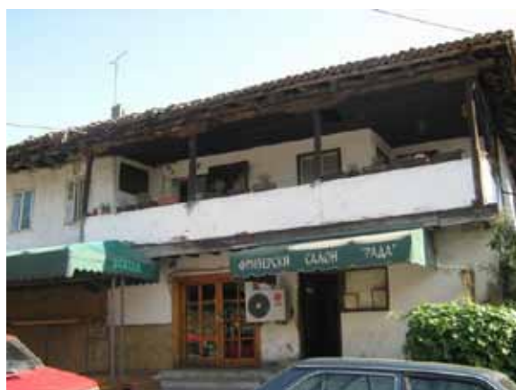
Sl. 68. Kafić i frizerski salon u kući Apostolovića

Upečatljiv objekat Savčićeve mehane nije u upotrebi, osim ulaznog dela, koji je zauzela prodavnica sa kineskom robom (Sl. 69, 70). Stara mehana, kao drugi istraženi ugostiteljski objekat, u kontinuitetu vrši svoju prvobitnu funkciju, s tim što jedan deo objekta koristi fotografska radnja. Sa table na fasadi objekta saznajemo da je ovde bilo i sedište Lovačkog društva Grocka, osnovanog davne 1900. godine.