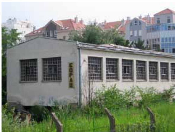
Sl. 54 „Borac“ i stambeni blokovi

Kada je reč o novobeogradskoj industriji, upečatljiv blok industrijskih objekata čine još uvek funkcionalan kompleks IMT-a, čija je prodaja i prenamena u planu 267 i zapušteni objekti preduzeća Success Borac 268 u Zemunskoj ulici u neposrednoj blizini modernih stambenih blokova (Sl. 54).