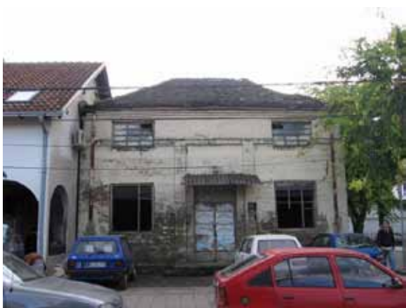
Sl. 87. Magacin porodice Knežević

I druga dva istražena magacina, iako manjih razmera, zavređuju pažnju kao objekti koji bi rekonstrukcijom, a s obzirom na položaj u centralnim obrenovačkim ulicama, mogli dobiti odgovarajuću novu namenu. Jedan od objekata nalazi se u tzv. „drugoј“ ulici, odnosno ulici Vojvode Mišića, a drugi – Magacin porodice Knežević u ulici Vuka Karadžića (Sl. 87). Treba pomenuti da su mnogi stari magacini u Obrenovcu već rekonstruisani i služe različitim namenama.