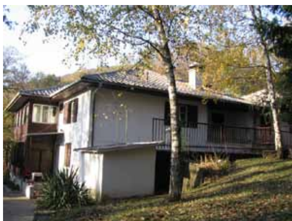
Sl. 103. Odmaralište PTT-a

Jedan od istraženih objekata je i dečje odmaralište u neposrednom susedstvu manastira Tresije, već neko vreme van upotrebe (Sl. 104).