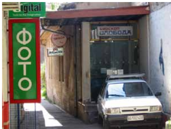
Sl. 62. Bioskop „Sloboda“

Bioskop „Sloboda“ „sakriven“ je u jednom od pasaža u Glavnoj ulici, u kome se nalaze i foto-radnja, kladionica, igraonica i kafe-bar (Sl. 62). Objekat, van upotrebe dugi niz godina, predviđen je za tržni centar (Sl. 63).