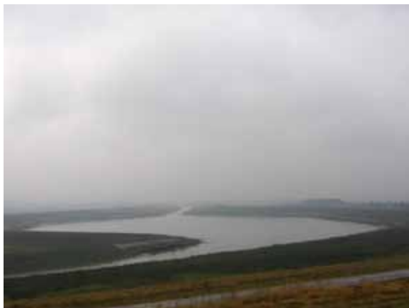
Sl. 76. Protočno jezero

da primi blizu 1.500 posetilaca, a koji je asfaltnim putem povezan sa glavnim saobraćajnicama i Beogradom (Sl. 77). Postoje ideje da se okolni „prazan“ prostor popuni novim sadržajima, a da protočno jezero u budućnosti postane turističko mesto.