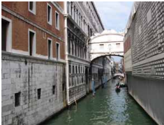
Sl. 4. Venecija – savremena Atlantida

čitavih gradova sa prvobitnih lokacija. 94 Posebno su fascinantna napuštena područja, gradovi, vojni kompleksi i nedovršeni građevinski poduhvati bivšeg Sovjetskog saveza. 95 Pojedini svetski gradovi, poput Detroita, Ivanova, Vitenberga ili Venecije – najpoznatijeg „umirućeg“ grada, predstavljaju kritične tačke u smislu mogućeg „nestanka“ (Sl. 4). 96