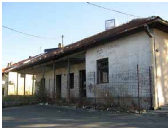
Sl. 47. Stara mehana u Kumodražu

Stara mehana u Kumodražu iz prve polovine XIX veka, pod zaštitom kao objekat narodnog graditeljstva, nekada je služila kao glavno svratište i konačište na starom kragujevačkom putu (Sl. 47). U međuvremenu, mehana je svoju ulogu menjala više puta, pa je tako tokom Drugog svetskog rata tu bila žandarmerijska stanica, 250 a do pre sedam-osam godina služila je kao ogranak Gradske biblioteke. 251 Slično drugim beogradskim opštinama i u opštini Voždovac postoji