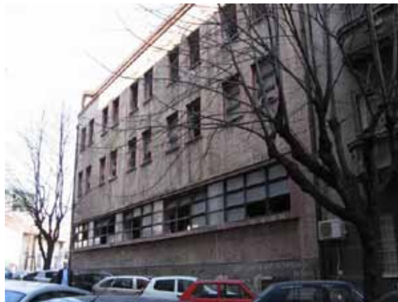
Sl. 34. Soko Štark

Predstavnici kinematografskih objekata na teritoriji opštine su bioskopi „Slavica“ i „Drina“. Bioskop „Slavica“ nalazi se u ulici Marijane Gregoran u centru beogradskog naselja Karaburma (Sl. 35, 36). 232 To je namenski projektovan bioskopski objekat, građen 1970. godine. Osim što je privatizovan, bioskop Slavica je danas van upotrebe i u potpunosti zapušten. Loše stanje u kome se objekat nalazi još više dolazi do izražaja u odnosu na lepo uređen park u kome je lociran, kao i u odnosu na osnovnu školu u neposrednom susedstvu. 233