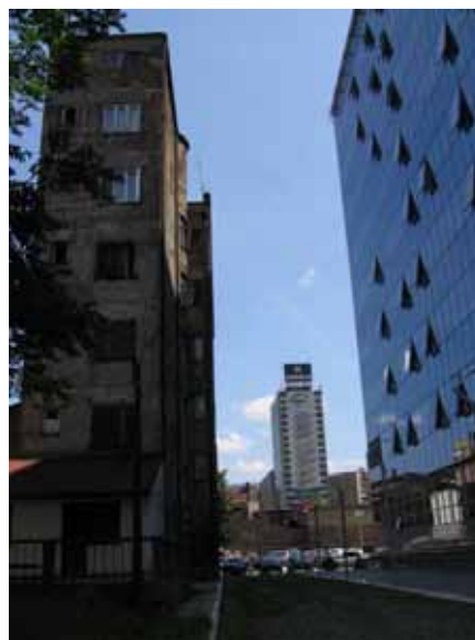
Sl. 6. XX vek

Kada je reč o istraženim praznim prostorima na teritoriji Beograda, situacija u pojedinačnim gradskim opštinama predstavljena je u pregledu koji sledi. Kako bi se prikazali procesi postepenog izrastanja grada, kao i procesi koji su doveli do postojanja praznih prostora, gradske opštine predstavljene su od centralnih ka perifernim. Takva podela odgovara i samom toku terenskog istraživanja.