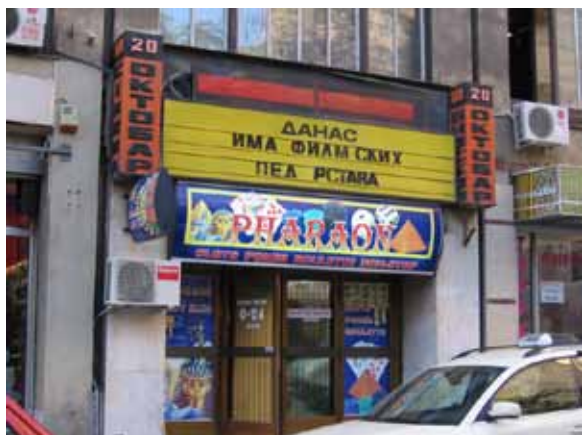
Sl. 16. „Faraon“ u bioskopu „20. oktobar“