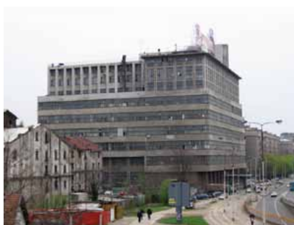
Sl. 28. Mlin i BIGZ – prvi susedi

Preko puta Starog mlina i BIGZ-a, u neposrednom susedstvu Beogradskog sajma, nalazi se još jedan značajan industrijski objekat. U pitanju je Fabrika hartije Milana Vape, izgrađena u periodu od 1921. do 1924. godine na prostranom zemljištu između železničke pruge i desne obale Save. U vreme kada je građena, spadala je u red velikih i modernih fabrika sa sopstvenom industrijskom železničkom prugom, kejom na obali Save za pristajanje brodova i šlepovima sa električnim kranom za