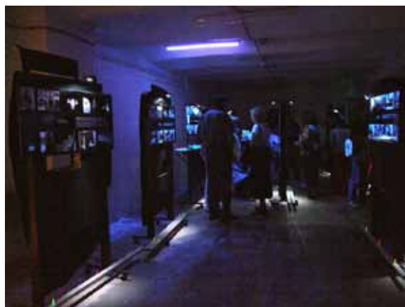
Sl. 20. Prezentacija magistarske teze u „Magacinu“

Ulica Kraljevića Marka spušta se prema savskoj obali i istraženju prostornoj celini u neposrednoj blizini Brankovog mosta. Istraživanje ovog dela Savskog venca predstavlja nastavak istraživanja desne savske obale na teritoriji Starog grada.