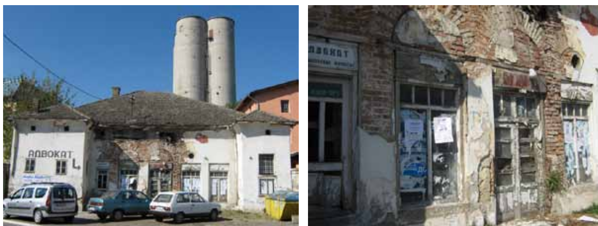
Sl. 64-65. Stara mehana

Jedan od njih je i potpuno oronula i zapuštena Stara mehana, koja se nalazi u samom centru Barajeva (Sl. 64, 65). Podignuta je u prvoj polovini XIX veka i predstavlja zametak barajevske čaršije Bagrdan, oko koje se formira trgovačko-poslovni centar sela Barajeva. 280 Vremenom je pretrpela različite izmene, u skladu sa zahtevima novih vlasnika i korisnika, a table koje se i danas mogu zateći na fasadi svedoče o pojedinim namenama kojima je služila. Objekat je pod zaštitom kao kulturno dobro.