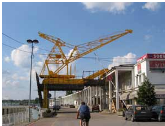
Sl. 13. Kran – odoleva vremenu

Pored istraženih industrijskih objekata, na teritoriji opštine Stari grad nalazi se i veliki broj objekata kinematografskog nasleđa. Većina bioskopa van funkcije koncentrisana je upravo na području centralne gradske opštine. Ovde su početkom XX veka i otvarani prvi beogradski bioskopi, od kojih se mnogi još uvek nalaze na prvobitnim lokacijama.