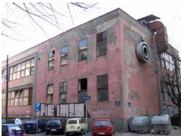
Sl. 33. Fabrika aviona /IKL/