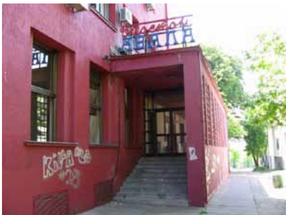
Sl. 38. „Avala“ – ulaz u bioskop

znake propadanja, a kompletan utisak dopunjen je prizorom terase na koju se nekad izlazilo iz bioskopa, a koja je danas puna đubreta i obrasla rastinjem (Sl. 38, 39).