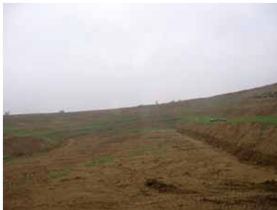
Sl. 77. Amfiteatar

Prilikom trećeg obilaska opštine, organizovan je obilazak sela Vreoci, kao i pojedinih objekata u samom Lazarevcu.