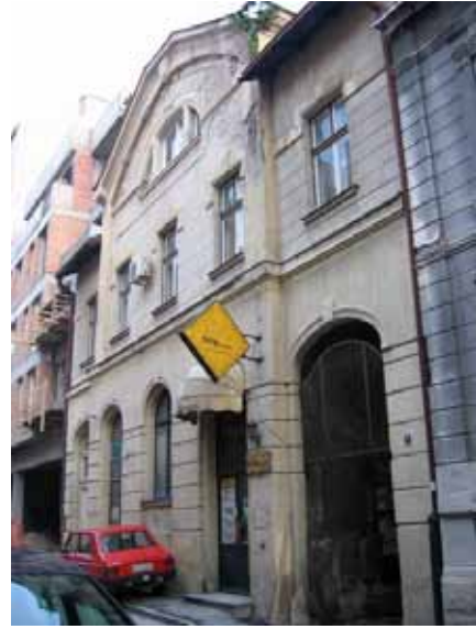
Sl. 42. Narodno kupatilo u Mišarskoj

Jedan od istraženih objekata je i Narodno kupatilo u Mišarskoj ulici, pod zaštitom kao objekat gradske arhitekture. Nije u osnovnoj funkciji, povremeno se koristi kao poslovni prostor, a ostaje otvoreno pitanje rekonstrukcije i buduće namene objekta (Sl. 42).