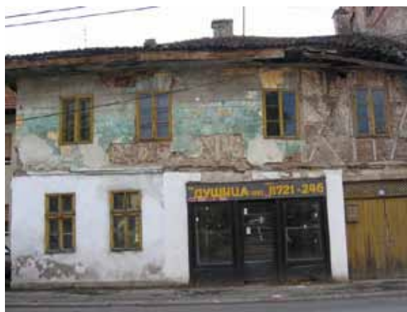
Sl. 90. Stara varoška kuća