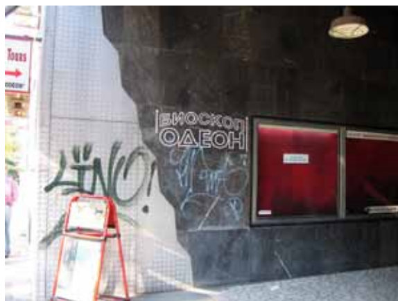
Sl. 18. „Odeon“

Poslednji kinematografski objekat van funkcije istražen na teritoriji Starog grada i jedini koji nije u vlasništvu „Beograd filma“, bioskop „Millenium“, nalazi se u Spasićevom prolazu, između Obilićevog venca i ulice Kneza Mihaila. Bioskop koristi deo stambenog objekta, a otvoren je posle 2000. godine na mestu gde se prvobitno nalazio bioskop „Mala Morava“.