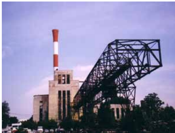
Sl. 8. TE „Snaga i svetlost“ 2007.

„Light and Craft“ podigla 1932. godine.“ 158 Obilaskom elektrane tokom 2009. godine, ustanovljeno je da najavljena rekonstrukcija još uvek nije započeta (Sl. 8, 9). Budući da se u okviru projekta rekonstrukcije pominju samo kran i crpna stanica, ostaje pitanje šta će se u budućnosti dogoditi sa samim objektom elektrane, koji je u priličnoj meri devastiran.