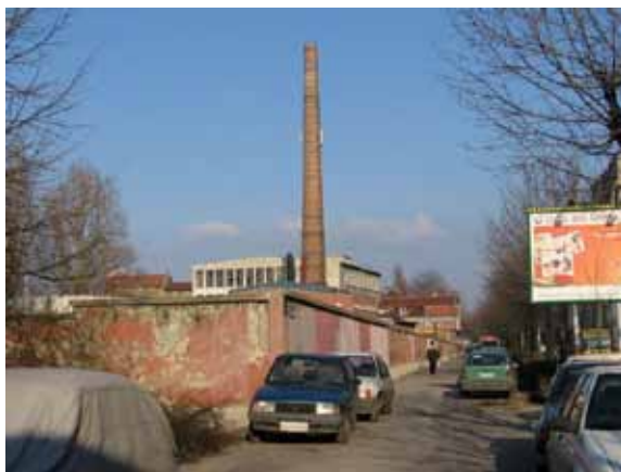
Sl. 32. Beogradski pamučni kombinat

vunarski kombinat. Oba kompleksa građena početkom XX veka, danas su privatizovana, a ostaje otvoreno pitanje revitalizacije i buduće namene.