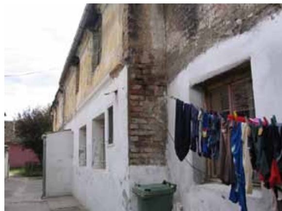
Sl. 85-86. Žitni magacin porodice Mirićić