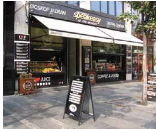
Sl. 15. Kafe u bioskopu „Jadran“

Bioskop „20. oktobar“, nekadašnji „Luksor“, nalazi se na početku Balkanske ulice, preko puta hotela Moskva. Spada u red najstarijih prostora za prikazivanje filmova kod nas i može se tretirati kao jedan od prvih duplekasa u Beogradu. Velika terasa na vrhu zgrade, nekada korišćena kao letnja bašta za prikazivanje filmova, danas je potpuno zapuštena. Zgrada u kojoj se bioskop nalazi, građena je 1920. godine, ali nije pod zaštitom. 179 Jedno vreme u holu bioskopa nalazio se tzv. slot klub (Sl. 16). 180 Objekat je danas van upotrebe.