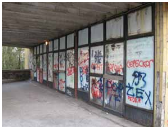
Sl. 51. „Fontana“