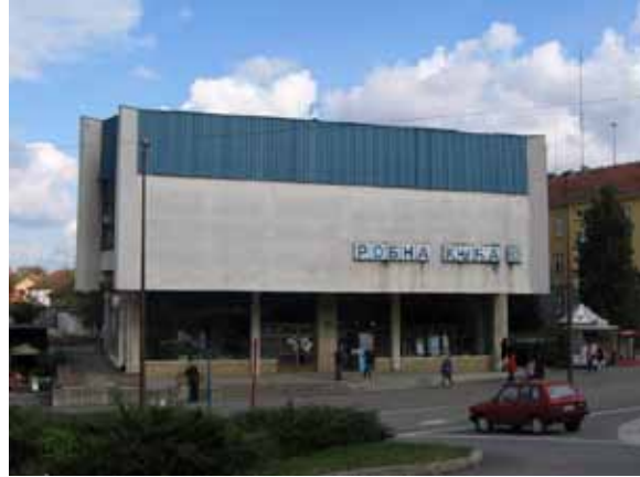
Sl. 94. Robna kuća „Ropočevo”

Fabrika manjeg obima “2. jul” i “Mona” nalazi se u neposrednoj blizini Centra za kulturu Sopot (Sl. 95). Radi se o objektu koji bi adaptacijom, takođe, mogao dobiti odgovarajuću novu namenu.