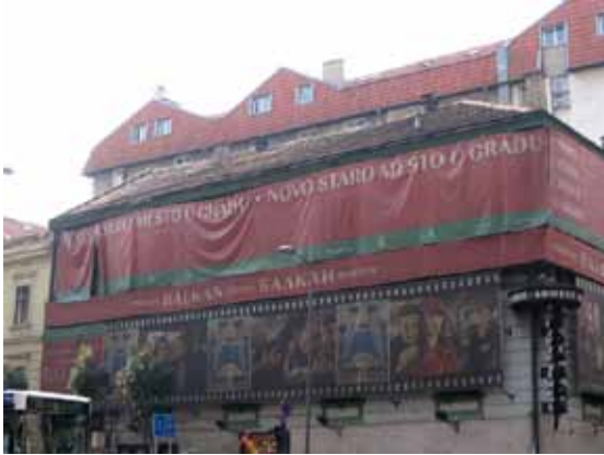
Sl. 14. Bioskop „Balkan“

tehnologiji, a najavljeno je da će repertoar naginjati “alternativnim” ostvarenjima. 178 Dolaskom novog vlasnika, od prethodno navedenih aktivnosti ostala je samo ugostiteljska.