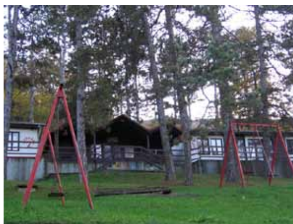
Sl. 104. Dečje odmaralište