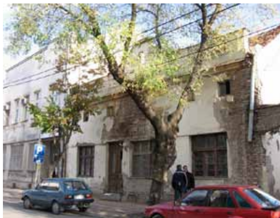
Sl. 88. Stara zgrada opštine

Stara zgrada opštine u ulici Miloša Obrenovića, u kojoj se nalaze tzv. socijalni stanovi, još jedan je od objekata koji zaslužuje pažnju, kako zbog položaja u glavnoj ulici, tako i zbog oronulosti i zapuštenosti kojom se izdvaja u odnosu na okolne objekte (Sl. 88).