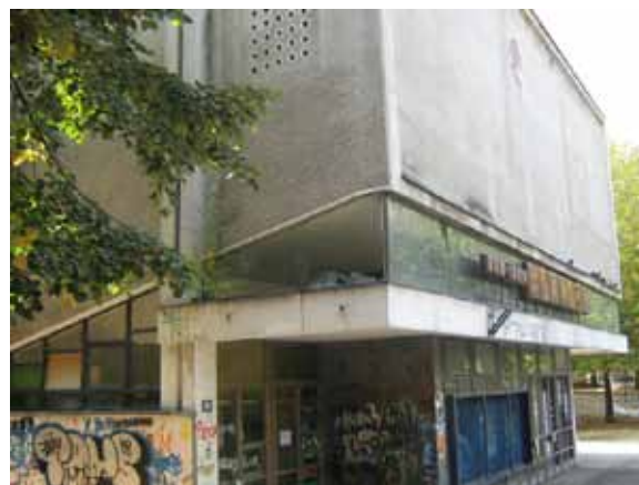
Sl. 35-36. Bioskop „Slavica“

Bioskop „Drina“ u Bulevaru despota Stefana jedno vreme je služio kao bazar robe, da bi slično bioskopu „20. oktobar“ u svom prostoru „ugostio“ slot klub „Faraon“. 234 Na tom mestu danas se nalazi kockarnica. 235