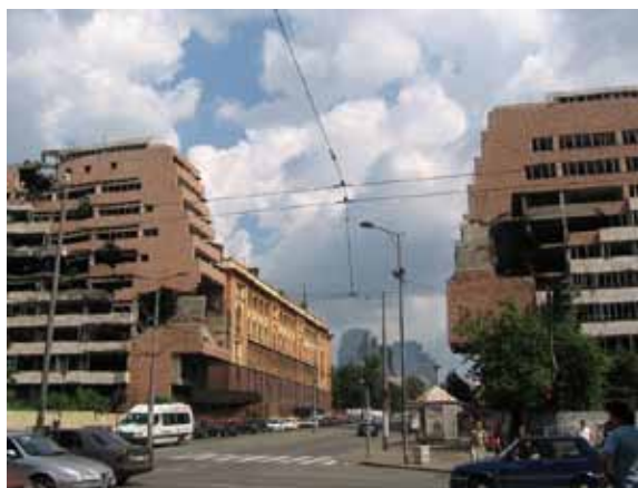
Sl. 26. Generalštab

U neposrednoj blizini Oficirske zadruge, u ulici Kneza Miloša, nalaze se zgrade Generalštaba arh. Nikole Dobrovića, najznačajniji objekti socijalističkog modernizma, teško oštećeni tokom bombardovanja Beograda 1999. godine (Sl. 26). 208 Generalštab nije predviđen za prodaju, a još uvek nije doneta odluka o njegovoj obnovi ili rekonstrukciji. 209