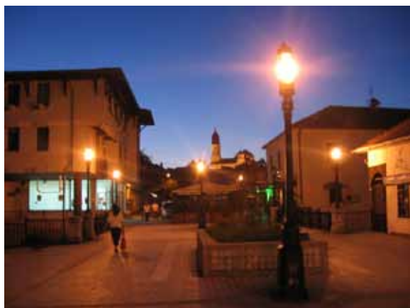
Sl. 67. Gročanska čaršija