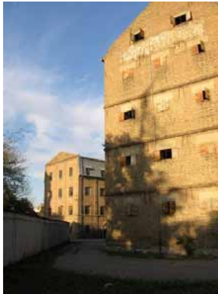
Sl. 84. Stari mlin

zahtevati prilagođavanje tog dobro očuvanog kompleksa okolini i to pre svega u funkcionalnom smislu.