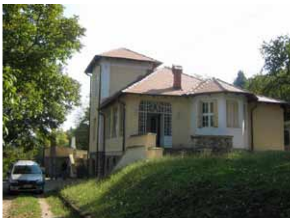
Sl. 74. Vila Gavrilović

Opširnija priča o „otkrivanju“ i rekonstrukciji ta dva objekta može se pogledati na sajtu Centra za kulturu Grocka. 295