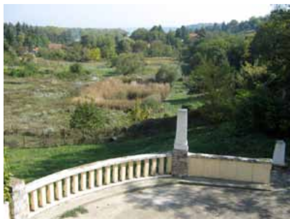
Sl. 75. Prostor predviđen za nove sadržaje