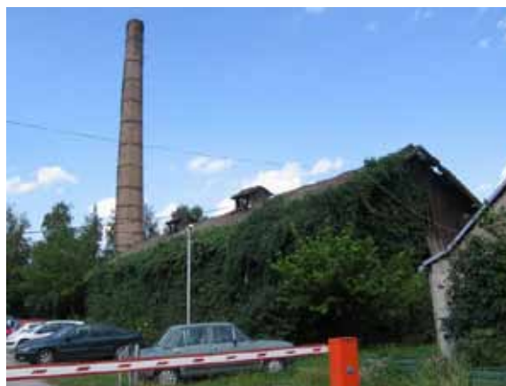
Sl. 60. Prva zemunska tvornica opeke

Tri istražena kinematografska objekta u Zemunu, nalaze se, što je fenomen po sebi, u istoj ulici. U pitanju su bioskopi „Central“, „Jedinstvo“ i „Sloboda“. Od bioskopa „Central“, u sastavu istoimenog hotela, na fasadi je ostao samo natpis sa nazivom, a prostor bioskopa danas služi kao prodajni centar – bazar (Sl. 61). Ulaskom u bioskop, zatičemo neobičnu situaciju: gustu mrežu tezgi postavljenu na ukošenom podu nekadašnje bioskopske sale, čija se prepoznatljiva konfiguracija ogleda i u postojanju uzdignute bine ispred nekadašnjeg platna za projekcije, kao i u