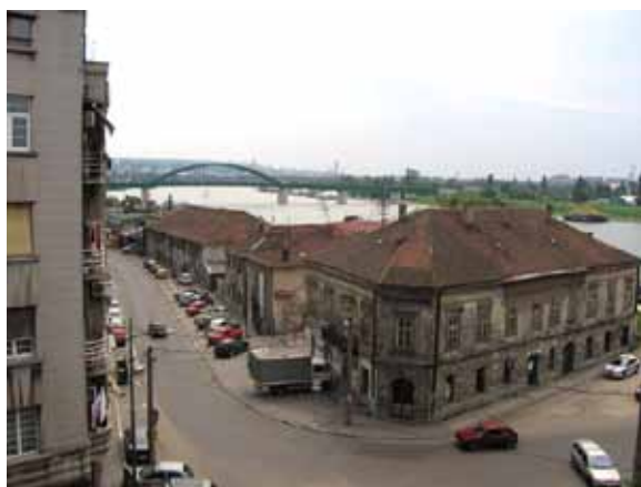
Sl. 21. Prostorna celina kod Brankovog mosta

Pored magacina adaptiranog u Kulturni centar Grad, u ulici Braće Krsmanović nalazi se zgrada stare carinarnice, 197 van upotrebe godinama unazad (Sl. 22). U tom objektu su, sudeći po oznakama na fasadi, tokom godina poslovala različita preduzeća. Nedavno je sa zgrade, koja je pod zaštitom, u potpunosti uklonjen krov, a izgleda da se radi o rekonstrukciji i restauraciji fasade. 198 Pitanje buduće namene objekta ostaje otvoreno.