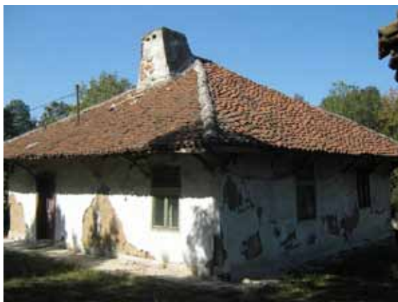
Sl. 66. Milovanovića kuća u Velikom Borku

Porodična kuća Radoja Jeftića u Šiljakovcu pod zaštitom je kao kulturno dobro. Ljubaznošću domaćina, oca sadašnje vlasnice, bilo je moguće pogledati i enterijer kuće. Kuća, koja pripada tipu višedelne, zadružne šumadijske čatmare 282 nije u upotrebi kao stambeni objekat i koristi se uglavnom za odlaganje stvari. Nije sigurno kakva je budućnost očekuje, s obzirom da, kako saznajemo, sadašnji vlasnici nisu u mogućnosti da samostalno izvrše njenu rekonstrukciju.