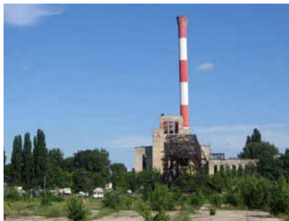
Sl. 9. TE „Snaga i svetlost“ 2009.

U neposrednoj blizini Dorćolske marine nalaze se i silosi „Žitomlina“, pomenuti u uvodu kao mesto koje se povremeno koristi u kulturno-umetničke svrhe. 159 Pojedini izvori govore u prilog tome da se na lokaciji „Žitomlina“ planira realizacija projekta stambeno-poslovnog kompleksa. Projektom je predviđeno da se, pored novoizgrađenih objekata, za različite sadržaje iskoriste već postojeći silosi i zgrada mlina. 160