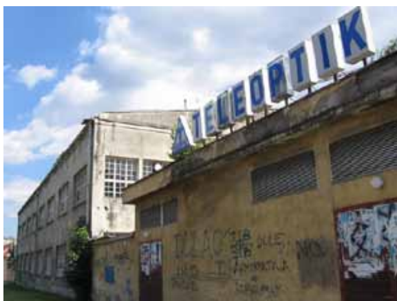
Sl. 57. „Teleoptik“

Industrija obuće „Beograd“ i „Teleoptik“ spadaju u istražene industrijske komplekse opštine Zemun (Sl. 57). Slično velikim industrijskim kompleksima u ostalim beogradskim opštinama, i ta nekada moćna preduzeća su privatizovana, ili u procesu privatizacije, a ostaje otvoreno pitanje njihove buduće namene.