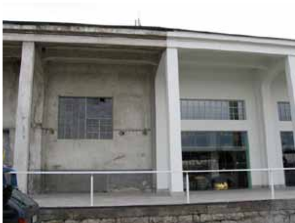
Sl. 12. Beton hala – staro i novo

Do nove promene u statusu objekta dolazi krajem 2009. godine, kada Beton hala prelazi u nadležnost Grada Beograda. Kako je najavljeno, po utvrđivanju zatečenog stanja, biće razmatrani predlozi za dalje korišćenje objekta. 166