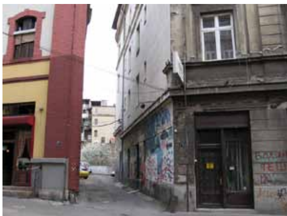
Sl. 19. Prilaz „Magacinu“

Jedan od transformisanih prostora u opštini Savski venac je i nekadašnji NOLIT-ov magacin knjiga u ulici Kraljevića Marka, 2007. godine adaptiran u programski prostor Doma omladine Beograda. 193 Osim što se prostire na dva nivoa od oko 1600m 2 , sama konfiguracija prostora pruža nebrojeno mnogo mogućnosti za organizovanje najrazličitijih događaja (Sl. 19). Tu je održana i prezentacija magistarske teze „Centar za scenska istraživanja – FABRIKA SNOVA“ (Sl. 20). 194