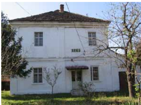
Sl. 81. Kuća Nedeljkovića

Treba pomenuti i kuću Paunovića (Sl. 82), kao i kuće porodice Tomašević u selu Šopić, danas predgrađu Lazarevca. Samo naselje Lazarevac zapravo je nastalo iz Šopića, a smatra se da su kuće porodice Tomašević među najstarijim podignutim u opštini Lazarevac.