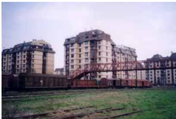
Sl. 7. Železnička stanica „Donji grad“

funkciju, sa perspektivom prestanka rada ukoliko se problem izmeštanja železničke pruge reši kako je prethodno pomenuto. Železnička stanica „Donji grad“ od značaja je za istraživanje i kao jedna od tačaka koja naglašava urbanistički apsurd pojedinih delova Beograda. Neposredno iza stanice, prema rečnoj obali i Dunavskom keju podignut je niz stambenih blokova, koji gledaju direktno na prugu i nizove starih železničkih kompozicija, formirajući pravi postindustrijski pejzaž (Sl. 7).