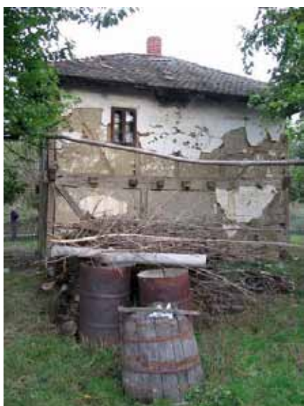
Sl. 82. Kuća Paunovića

Treba pomenuti i kuću Paunovića (Sl. 82), kao i kuće porodice Tomašević u selu Šopić, danas predgrađu Lazarevca. Samo naselje Lazarevac zapravo je nastalo iz Šopića, a smatra se da su kuće porodice Tomašević među najstarijim podignutim u opštini Lazarevac.