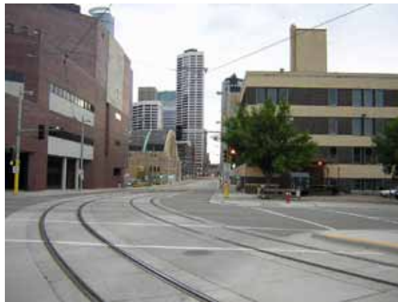
Sl. 1. Ulice Mineapolisa (Minesota, SAD) u toku radnog vremena

Praznina često asocira na ispraznost savremenog načina života. U figurativnom smislu stanje dosade, otuđenosti i apatije simbolički može biti predstavljeno praznim prostorima u velikim gradovima, npr. potpuno pustim ulicama u toku radnog vremena (Sl. 1).