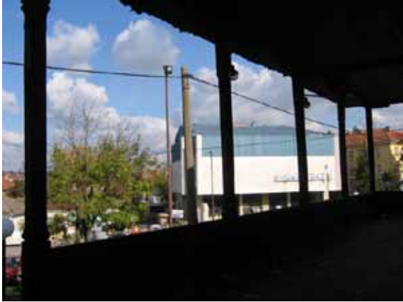
Sl. 93. Kosmajski trg – Pogled iz Hana na Robnu kuću