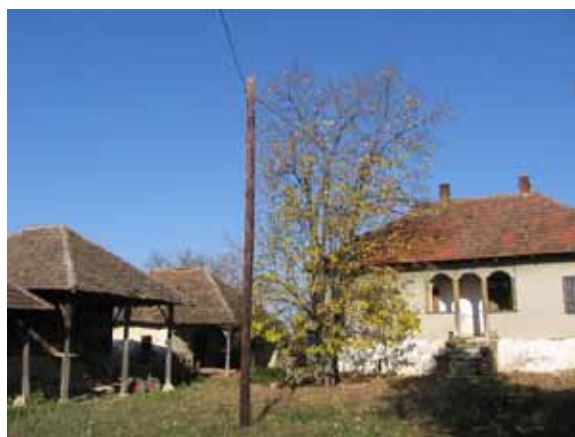
Sl. 99. Imanje porodice Stanić

Napušteno imanje porodice Stanić privuklo je pažnju naročito zbog autentičnih pomoćnih objekata, smeštenih u nizu sa jedne od bočnih strana stambenog objekta (Sl. 99). Po rečima meštana, zbog događaja koji su se odigrali u prošlosti kuća se smatra ukletom, a to je i osnovni razlog što se do sada još uvek niko nije odvažio da je kupi.