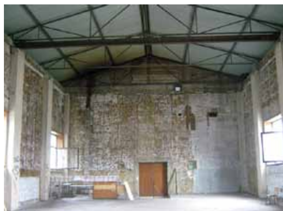
Sl. 105. i 106. Dom kulture u Dobanovcima

U neposrednom susedstvu Doma kulture nalazi se objekat nekadašnje školske kuhinje Osnovne škole „Stevan Sremac“. Objekat planiran za salu za fizičko u potpunosti je devastiran, a posebnu opasnost predstavlja to što se takav prostor nalazi u blizini školskog objekta (Sl. 107, 108).