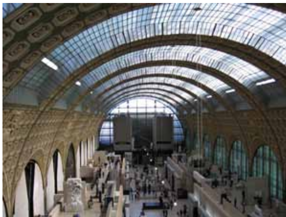
Sl. 115. Musee d'Orsay

U pojedinim gradovima, objekti za saobraćaj i komunikacije transformisani su u kulturno-umetničke prostore. U našem neposrednom susedstvu, u Rijeci, železnička stanica namenjena je za muzej savremene umetnosti, 372 a jedan od najlepših primera adaptacije ove vrste građevina je svakako Musee d'Orsay u Parizu, takođe u prostoru nekadašnje železničke stanice (Sl. 115). 373