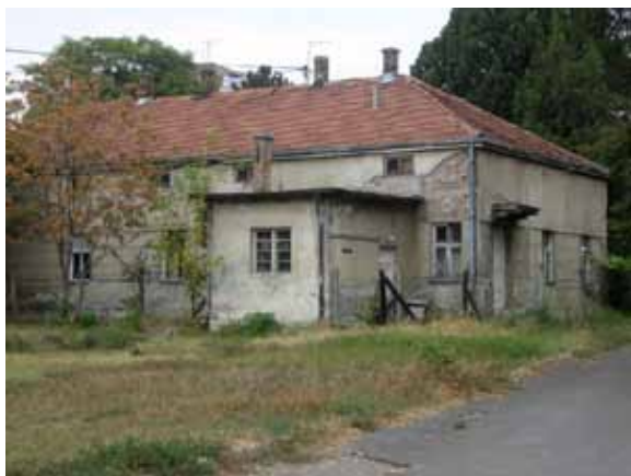
Sl. 55. Kasarna „Jakub Kuburović“

kvadrata, jedan je od gradskih vojnih kompleksa, za koji vlada najveće interesovanje. 271