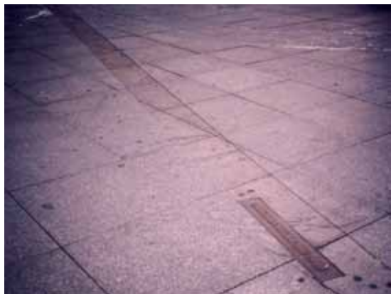
Sl. 110. Tragovi prošlosti na Potsdamer Platz-u