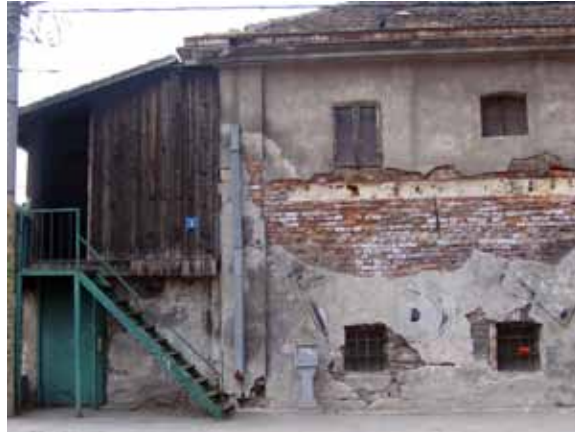
Sl. 23. Magacin u ul. Braće Krsmanović

Krećući se iz ulice Braće Krsmanović, Travničkom prema Karađorđevoj ulici, nailazimo na manji objekat, magacin „Metalservisa” van upotrebe. Objekat je „zalepljen” za jednu od najlepših građevina u Beogradu – zgradu Beogradske zadruge (Sl. 24).