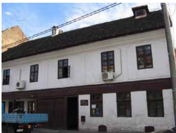
Sl. 89. Česni dom porodice Mihailović

balkanske arhitekture.” 313 Ipak, ta kuća na kojoj je jasno istaknuto upozorenje o mogućnosti urušavanja, danas isključivo predstavlja opasnost za prolaznike.