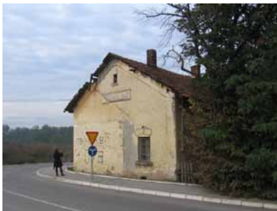
Sl. 83. Stara železnička stanica u Lazarevcu

Pažnju je privukao i objekat stare železničke stanice u Lazarevcu, koji već dugi niz godina ne vrši svoju prvobitnu funkciju (Sl. 83). Ipak, objekat nije prazan, a njegova trenutna namena je stambena.