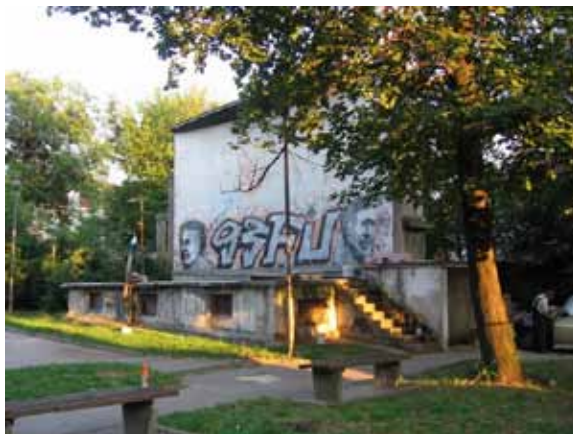
Sl. 45. Letnja bašta „Beograd“

Jedini istraženi kinematografski objekat u opštini Zvezdara je Letnja bašta „Beograd“, nekada bioskop na otvorenom u Bregalničkoj ulici (Sl. 45). Na parceli od 25 ari nalaze se izbetoniran plato – letnja bašta bioskopa, projektorska kuća i bivša pozornica, 242 koje se sada u koriste u stambene svrhe. Prostor, privatizovan kao i većina drugih kinematografskih objekata, predviđen je za prodaju. 243