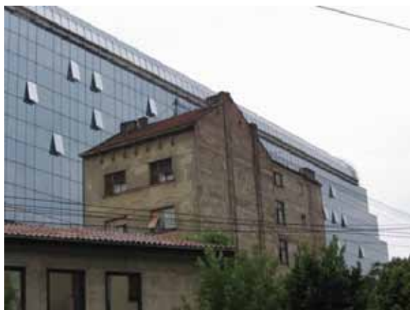
Sl. 5. Staro i novo