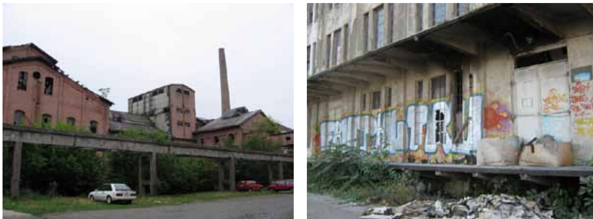
Sl. 48-49. Prva srpska fabrika šećera

istraživanja, prostire se pored Ade Ciganlije na površini zemljišta od 7,4 hektara. Proizvodnju je ugasila 1982. godine, a najznačajniji objekti su upravna zgrada, glavna hala, sušara rezanaca i tri magacina.