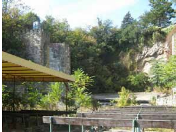
Sl. 30. Letnja pozornica u Topčideru

za orkestar i izvođače, bila je samo deo celine u kojoj je kasnije trebalo izgraditi upravnu zgradu sa garderobama, galeriju sa još 700 mesta, hotel za gostujuće umetnike. Međutim, posle samo nekoliko sezona, zbog letnjih kiša i činjenice da ovaj prostor nije održavan, pozornica je polako počela da odumire i zarasta u korov da bi, izuzev nekoliko tehno-žurki, u njoj opstao samo restoran „Topčiderska noć”. 222