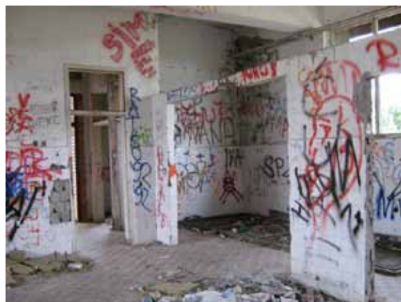
Sl. 107-108. Devastirana „školska kuhinja“

Jedina dva istražena poljoprivredna objekta nalaze se u surčinskom naselju Progar, poznatom po održavanju manifestacije „Bojčinsko kulturno leto“.