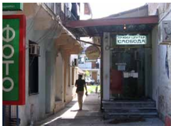
Sl. 63. Tržni centar „Sloboda“