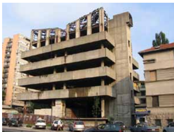
Sl. 40. Nedovršeni objekat u Južnom bulevaru

Kada su u pitanju nedovršeni građevinski poduhvati, treba pomenuti poslovni objekat u delu Južnog bulevara prema Autokomandi (Sl. 40). Gradnja tog objekta počela je još 90-ih godina prošlog veka. Osim što predstavlja ruglo za nedavno renoviran Južni bulevar, taj objekat postao je i mesto okupljanja „ilegalnih stanara“.