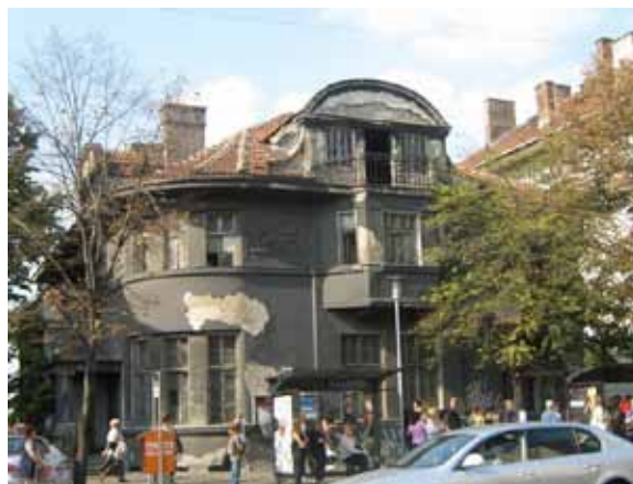
Sl. 31. Kuća u Kneza Miloša 66

Istraživanjem jednog od „zagonetnih“ praznih prostora na teritoriji Savskog venca u ulici Kneza Miloša preko puta Opštine Savski venac, a u neposrednom susedstvu ambasada Nemačke i Hrvatske, došlo se do saznanja da je u pitanju objekat u vlasništvu Republike Gvineje (Sl. 31). Kako je sredinom 2008. godine najavio ambasador te države u Beogradu, trebalo je da objekat postane diplomatsko predstavništvo države, koje će pokrivati ceo Balkan. 223 Ipak, revitalizacija i rekonstrukcija objekta do danas nisu započete.