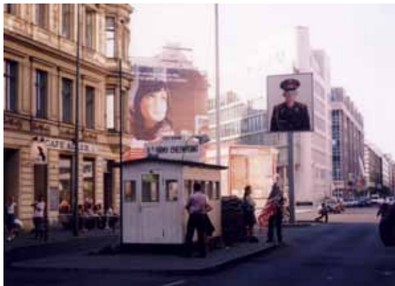
Sl. 111. Check Point Charly

Pored Starog sajmišta, istorijski značajne celine u Beogradu poput Skadarlije i Kosančićevog venca zaslužuju dodatnu pažnju, u smislu eliminisanja nepotrebnih sadržaja, očuvanja „atmosfera“ i naglašavanja njihovog kulturno-istorijskog značaja. Isto važi i za očuvane celine u manjim mestima na teritoriji Beograda, npr. Gročansku čaršiju u Grockoj, koja bi dodatnim uređenjem i popunjavanjem postojećih sačuvanih objekata adekvatnim sadržajima, mogla postati značajna turistička destinacija.