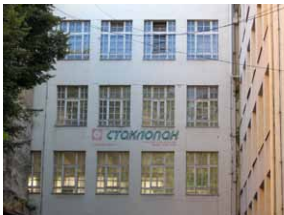
Sl. 10. „Staklopan“

Prvi sused „Staklopana“ je i najstariji sačuvan stambeni objekat u Beogradu, sagrađen sa još šest identičnih zdanja od 1724. do 1727. godine u vreme austrijske vladavine Beogradom (Sl. 11).