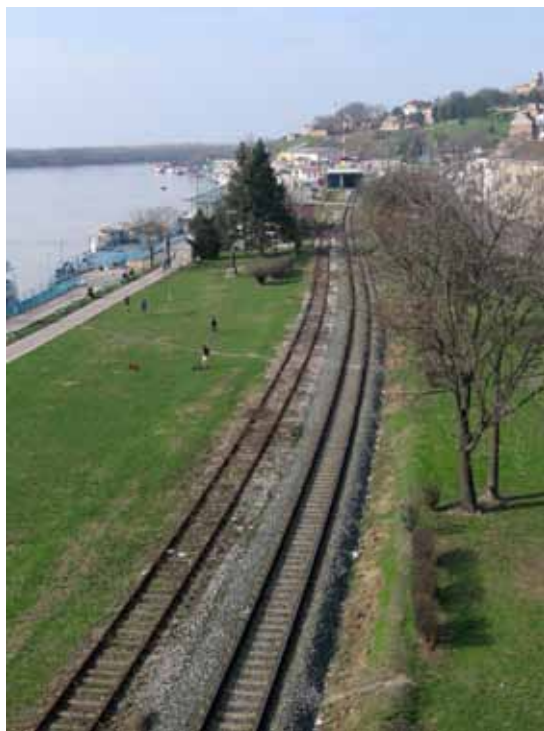
Sl. 11. Železnička pruga, još uvek u funkciji

Save od Karađorđeve ulice i stepeništa koje vodi ka Kosančićevom vencu i centru grada. (Sl. 11).