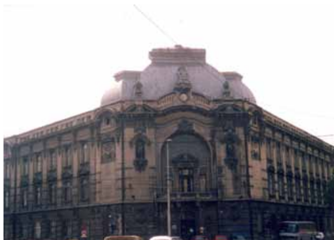
Sl. 24. Beogradska zadruga

predlogu Zavoda za zaštitu spomenika kulture grada Beograda, zdanje Beogradske zadruge namenjeno je za zadužbinu sveukupnog stvaralaštva Srba u svetu. 203