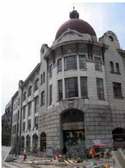
Sl. 25. Oficirska zadruga