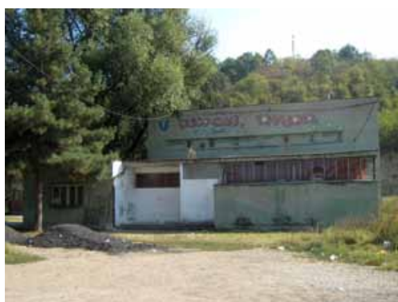
Sl. 73. Dom kulture u Begaljici

Kada je reč o prostorima za kulturno-umetničku delatnost i zabavu, treba pomenuti i jedini istražen dom kulture, koji se nalazi u gročanskom naselju Begaljica (Sl. 73). Potpuno izdvojen kao građevina, Dom kulture je tokom godina menjao svoju namenu, pa je tu jedno vreme bila diskoteka, kao i igraonica tombole. Nije bilo moguće pogledati unutrašnjost građevine, ali po informacijama koje smo dobili, veliki deo objekta zauzima sala, koja se nekada koristila u različite svrhe. 291