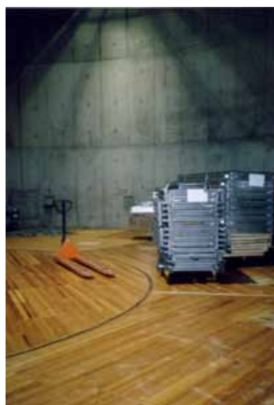
Sl. 113-114. Schaubühne am Lehniner Platz