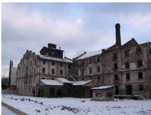
Sl. 27. Mlin Prvog akcionarskog društva

Zgrada BIGZ-a (Beogradskog grafičko-izdavačkog zavoda), odnosno Velike državne štamparije, sagrađena je od 1935. do 1940. godine po projektu Dragiše Brašovana (Sl. 28). 214 Donedavno BIGZ je radio smanjenim kapacitetom, što je uslovalo pražnjenje čitavih spratova, koji su zatim delimično popunjeni novim sadržajima. Prostor je privatizovan, a izdaje se u zakup umetničkim ateljeima, muzičkim studijima i sl. Iako se ne može govoriti o organizovanom „osvajanju“ BIGZ-a, činjenica je da je deo ovog prostora već neko vreme „jedno od žarišta prestoničkog anderground života”. 215 Umetnici koji ovde rade osnovali su i udruženje građana pod nazivom Manekeni BIGZ-a „sa ciljevima okupljanja umetnika i promocije njihovog rada, integracije ugroženih i diskriminiranih društvenih i kuturoloških podgrupa u šire društvo, i razvoja ekološke svesti i svesti o ljudskim pravima.” 216 Neizvesno je koliko će trenutna situacija potrajati i da li će i BIGZ uskoro dobiti novu i ne-umetničku funkciju.