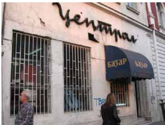
Sl. 61. Bazar u „Centralu“

Bioskop „Jedinstvo“, izvesno vreme izdavan u zakup kao poslovni prostor, tokom 2009. godine promenio je vlasnika i transformisan je u prodavnicu konfekcije.