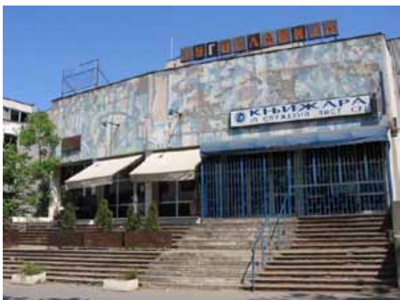
Sl. 50. „Jugoslavija“

„Fontana“, kultni novobeogradski bioskop, sada u prilično lošem stanju, trebalo bi da po rešenju izvesnih imovinsko-pravnih problema i renoviranju postane višenamenski kulturni centar za građane od 18 do 30 godina. Kulturno-poslovni centar „Fontana“, u čijem se sastavu bioskop nalazi, uživa status prethodne zaštite kao objekat gradske arhitekture (Sl. 51).