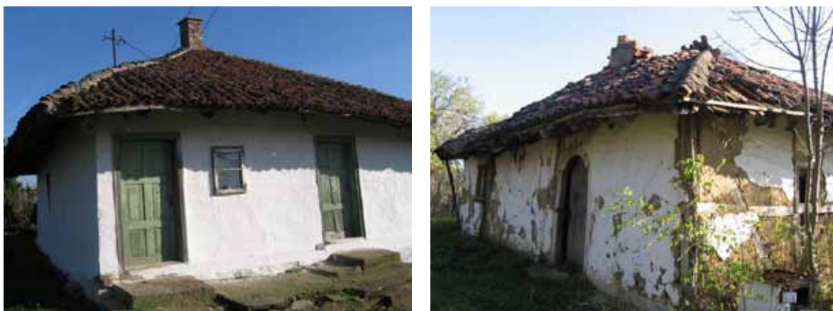
Sl. 101-102. Očuvano i oronulo

Razlike u održavanju objekata dolaze do izražaja poređenjem još dve kuće istražene u Drlupi – kuće Blagojevića u dobrom stanju i u potpunosti devastirane kuće Miroševića (Sl. 101, 102).