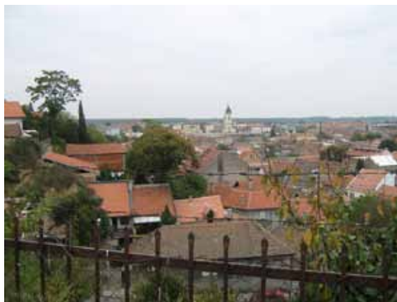
Sl. 56. Pogled iz kasarne na Zemun

Industrija obuće „Beograd“ i „Teleoptik“ spadaju u istražene industrijske komplekse opštine Zemun (Sl. 57). Slično velikim industrijskim kompleksima u ostalim beogradskim opštinama, i ta nekada moćna preduzeća su privatizovana, ili u procesu privatizacije, a ostaje otvoreno pitanje njihove buduće namene.