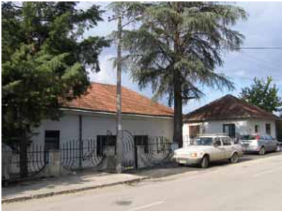
Sl. 95. „2. jul” i „Mona”

Fabrika manjeg obima “2. jul” i “Mona” nalazi se u neposrednoj blizini Centra za kulturu Sopot (Sl. 95). Radi se o objektu koji bi adaptacijom, takođe, mogao dobiti odgovarajuću novu namenu.