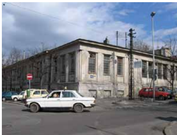
Sl. 29. Inex Borac = Success Borac

U delu Savskog venca prema Karađorđevom parku u blizini Kliničkog centra Srbije, nailazimo na izuzetno dobro očuvan industrijski objekat iz prve polovine XX veka, u kome je dugi niz godina poslovalo preduzeće Inex Borac – Industrija precizne mehanike, elektrotehnike i metalnih proizvoda. Druga dva objekta ovog preduzeća smeštena su na teritoriji opštine Novi Beograd i danas su van upotrebe. 218 Posle 2000. godine preduzeće je privatizovano, a sada radi znatno smanjenim kapacitetom, pod nazivom Success Borac (Sl. 29).