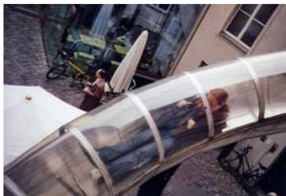
Sl. 112. KW Berlin

Samo jedan od mnogobrojnih stranih primera kako se takav objekat može vratiti u život je napuštena fabrika margarina u Berlinu, 361 transformisana u danas značajan kulturni centar Kunst-Werke Berlin (Sl. 112). 362 Vredi pomenuti i „Tejt Modern“ (Tate Modern) galeriju u Londonu u zdanju nekadašnje električne centrale. 363