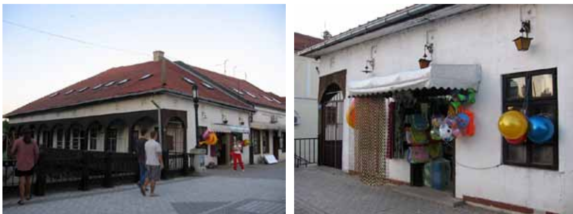
Sl. 69-70. Kineska prodavnica u Savčićevoj mehani

U Čaršiji, odnosno današnjem Bulevaru oslobođenja, nailazimo i na modernije poslovne objekte, od kojih su pojedini takođe van upotrebe. U pitanju su objekti u kojima su nekada radile prodavnice konfekcije, a u jednom od njih, kako saznajemo, nalazila se i bioskopska sala.