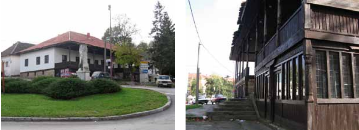
Sl. 91-92. Sopotski han

Sopotski han, zaštićen kao kulturno dobro od velikog značaja, izgrađen je verovatno sredinom XIX veka, kada nov evropski sistem izolovanih prenočišta zamenjuje stari princip skupnih prostorija sa ležajima i zajedničkih soba (Sl. 91, 92). 317 Osnova hana je dužine 22 i širine 16 metara, a objekat ima dva nivoa: prizemlje i sprat. Han se tretira kao monumentalno zdanje narodne arhitekture “sa jakim uticajem najboljih tradicija narodnog graditeljstva Makedonije”. 318 Osim što je arhitektonski reprezentativan, Han je istorijski izuzetno značajan i po svojoj sadržini i funkciji, a naročito ako se uzme u obzir da su takvi objekti sačuvani kod nas u veoma malom broju. 319 Prilikom druge restauracije 1969. i 1970.godine, zgradi je trebalo da bude vraćena ugostiteljska namena. 320