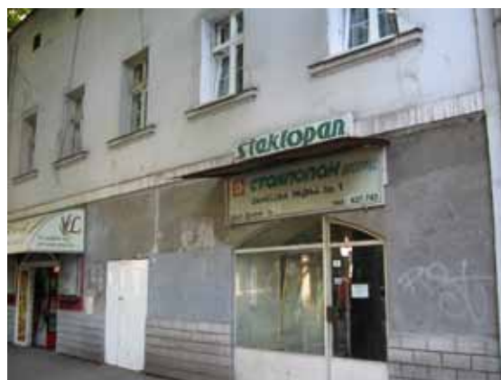
Sl. 11. Najstarija kuća u Beogradu

Sledeći istražen objekat na teritoriji Starog grada potvrđuje da su obale beogradskih reka predodređene za formiranje najzagonetnijih i urbanistički najdiskutabilnijih gradskih celina. Kao pandan TE „Snaga i svetlost“, sa suprotne strane Kalemegdanske tvrđave, na desnoj obali Save, smestili su se nekadašnji magacini pristaništa Beograd, poznati pod nazivom Beton hala. U blizini današnjeg pristaništa „Sava“, magacini su izgrađeni oko 1937. godine kako bi služili za smeštaj robe dopremane rekom.