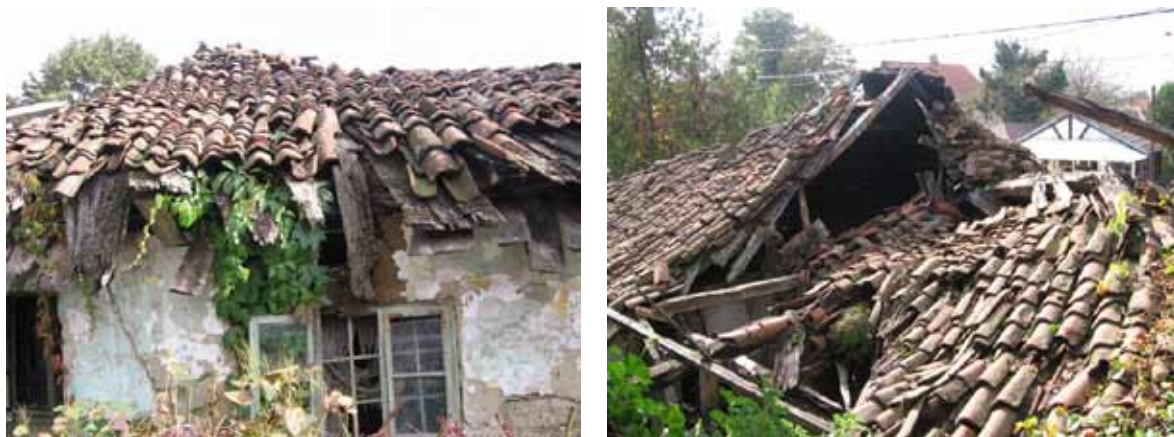
Sl. 79-80. Stara kuća porodice Miletić

Kuća, zaštićena kao spomenik kulture, a podignuta verovatno sredinom XIX veka, 302 nalazi se u centru sela Vreoci, na neadekvatnoj lokaciji, uz prometnu saobraćajnicu. Uprkos planiranoj dislokaciji, 303 kuća do danas nije izmeštena, a njeno stanje se vremenom u znatnoj meri pogoršalo (Sl. 79, 80).