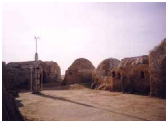
Sl. 2. Chott el Gharsa, Tunis, jedna od lokacija na kojima je sniman film Ratovi zvezda , danas prazan prostor i turistička destinacija

Treba pomenuti i film kao medij koji je nebrojeno puta koristio postojeće napuštene prostore kao scenografiju. 82 Sa druge strane, scenografije izrađene za pojedine filmove, po završetku snimanja postale su prazni prostori, a neke od njih danas su turističke atrakcije (Sl. 2). 83