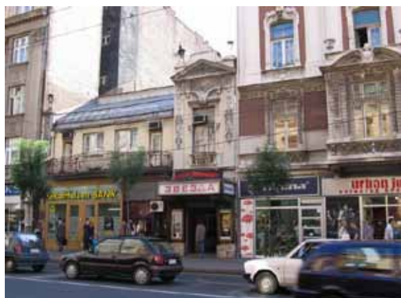
Sl. 17. Bioskop „Zvezda“