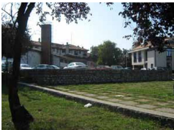
Sl. 72. Letnja pozornica

U naselju Grocka istražen je i jedan od prostora za kulturno-umetničku delatnost i zabavu na otvorenom. U pitanju je na prvi pogled teško uočljiva letnja pozornica, čija se bina danas uglavnom koristi kao parking (Sl. 72). Jedna od prednosti pozornice ogledala se i u mogućnosti posmatranja različitih manifestacija sa suprotne padine reke Gročice, koja protiče ovim delom naselja.