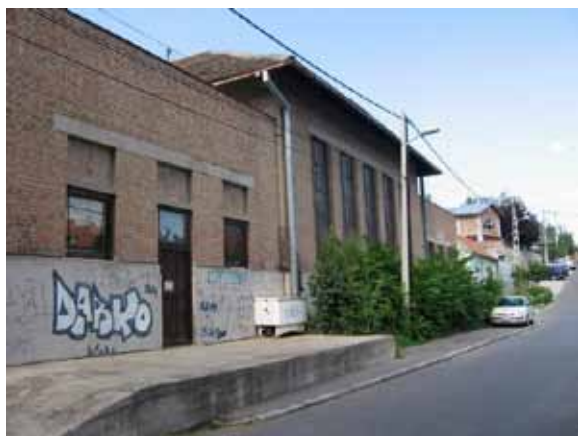
Sl. 59. Gradska klanica Zemun

Prva zemunska tvornica opeke, u neposrednom susedstvu Instituta za fiziku Srbije, obrasla rastinjem i u očigledno lošem stanju, verovatno bi zahtevala prilična ulaganja u smislu moguće revitalizacije i prenamene (Sl. 60). U znatno boljem stanju je objekat Gradske klanice Zemun, u upotrebi kao poslovni i magacinski prostor (Sl. 59).