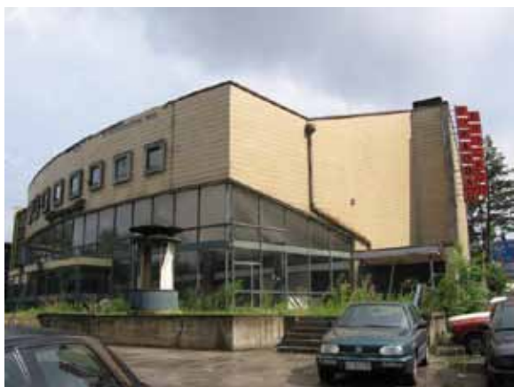
Sl. 46. Bioskop „Voždovac“

U nekoliko navrata potpisivane su peticije i organizovane akcije i performansi za ponovno otvaranje bioskopa kao višenamenskog centra, ali bez rezultata. 249 “Voždovac” je i dalje zatvoren, a njegova sudbina za sada neizvesna.