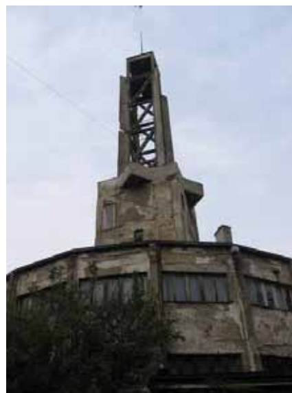
Sl. 52-53. Staro sajmište