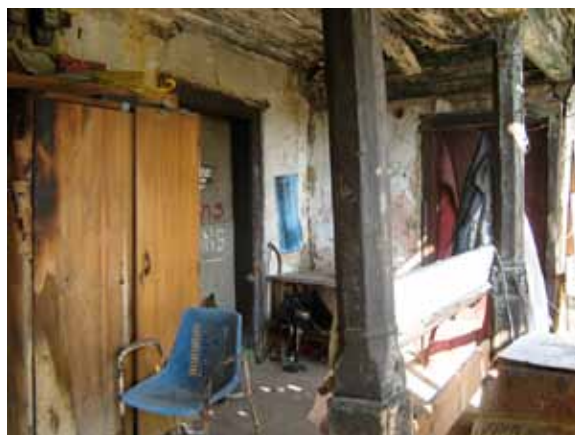
Sl. 71. Vlajkovićeva kuća

U naselju Grocka istražen je i jedan od prostora za kulturno-umetničku delatnost i zabavu na otvorenom. U pitanju je na prvi pogled teško uočljiva letnja pozornica, čija se bina danas uglavnom koristi kao parking (Sl. 72). Jedna od prednosti pozornice ogledala se i u mogućnosti posmatranja različitih manifestacija sa suprotne padine reke Gročice, koja protiče ovim delom naselja.