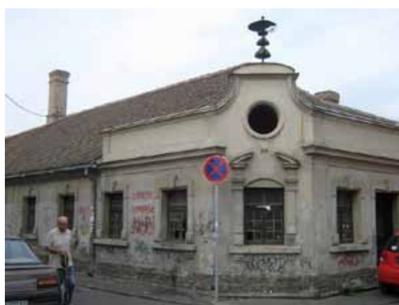
Sl. 58. Livnica „Pantelić“

Od manjih industrijskih objekata istraženi su: Livnica „Pantelić“, Prva zemunska tvornica opeke i Gradska klanica Zemun.